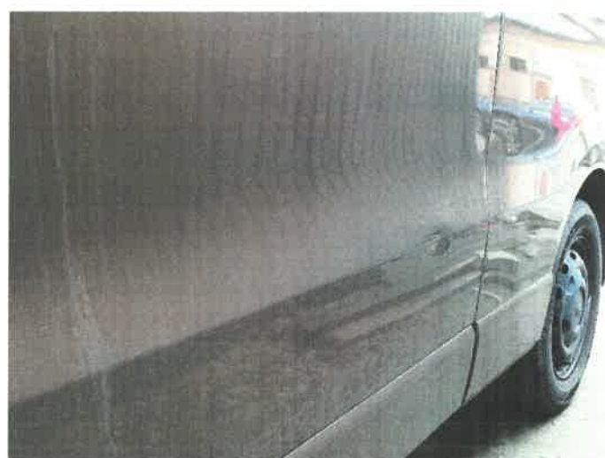
Opel Vivaro DTR 95422