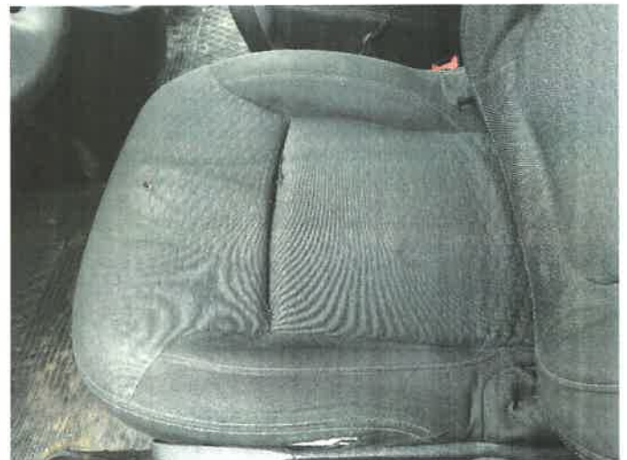
Opel Vivaro DTR 95422